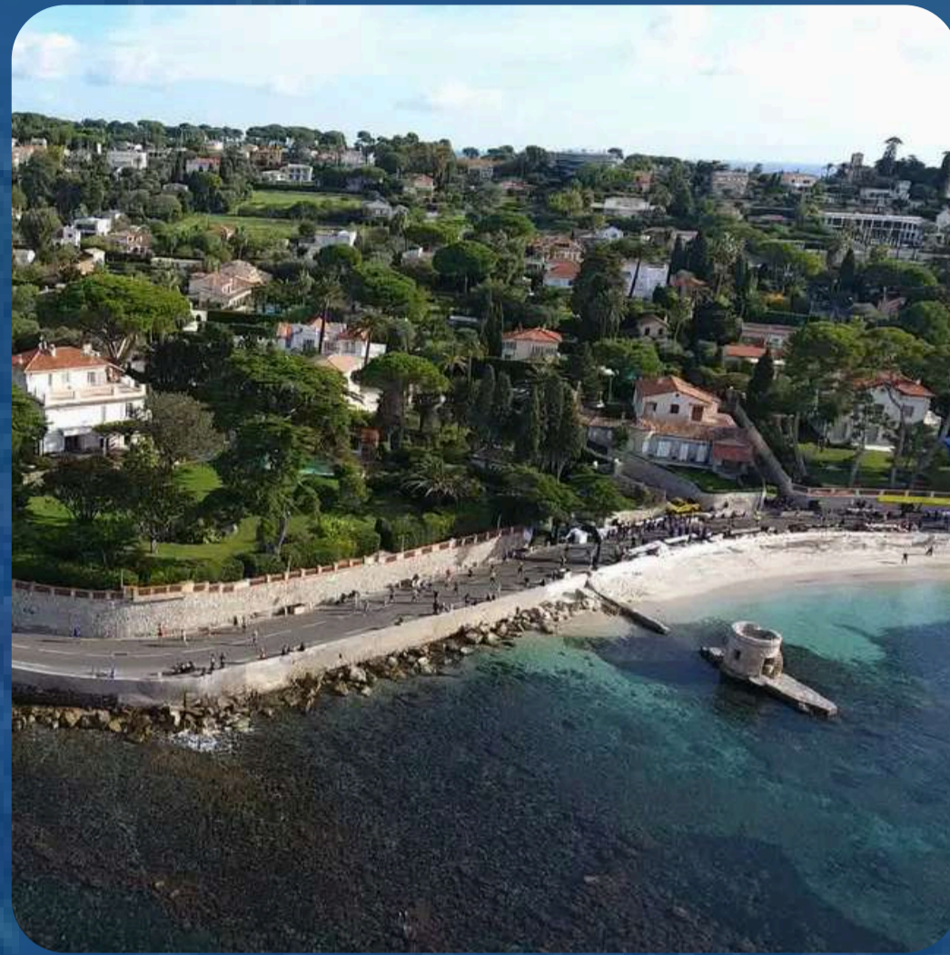
“Le Cap d'Antibes”