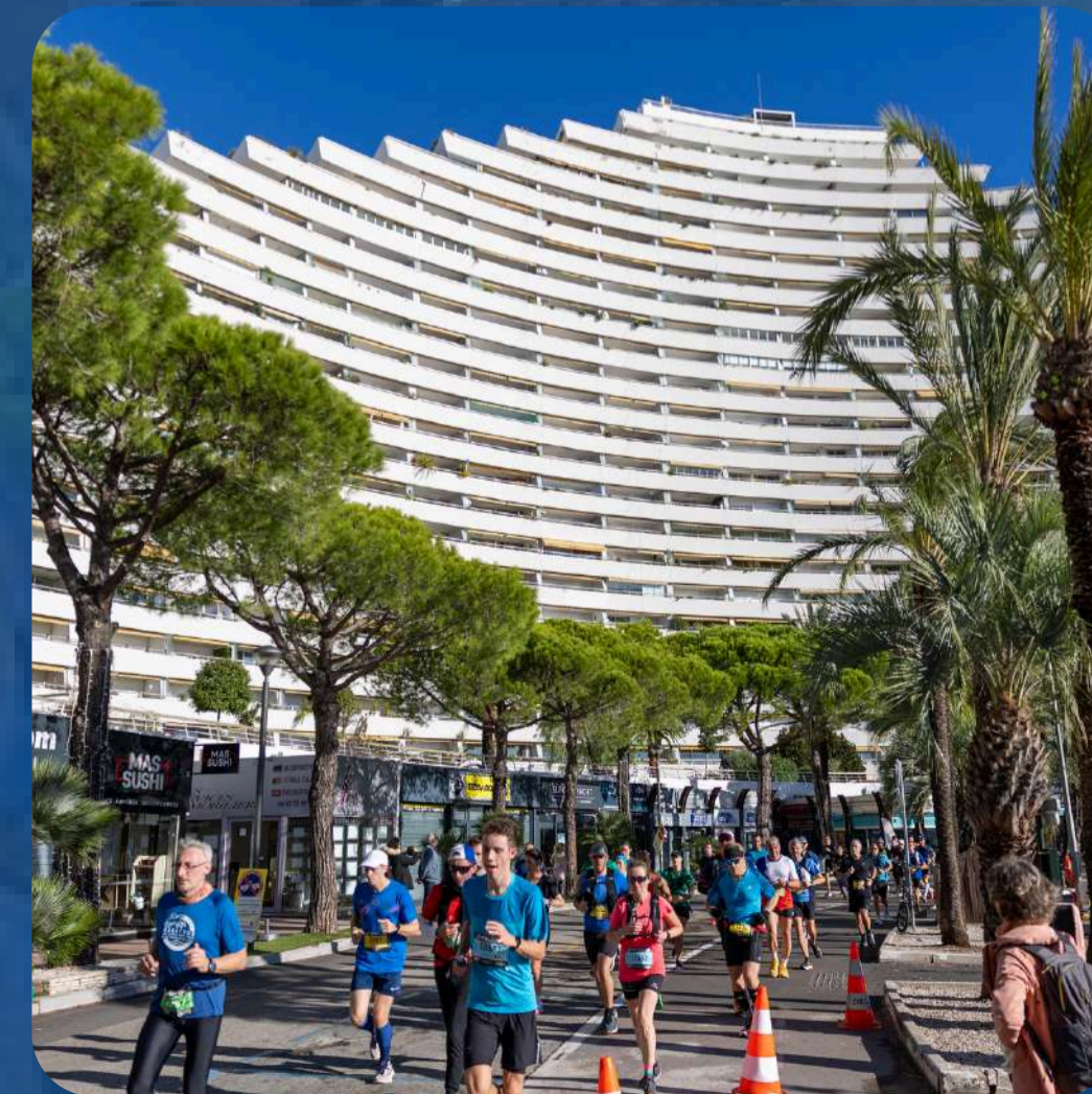
“Marina Baie des Anges à mi-parcours”