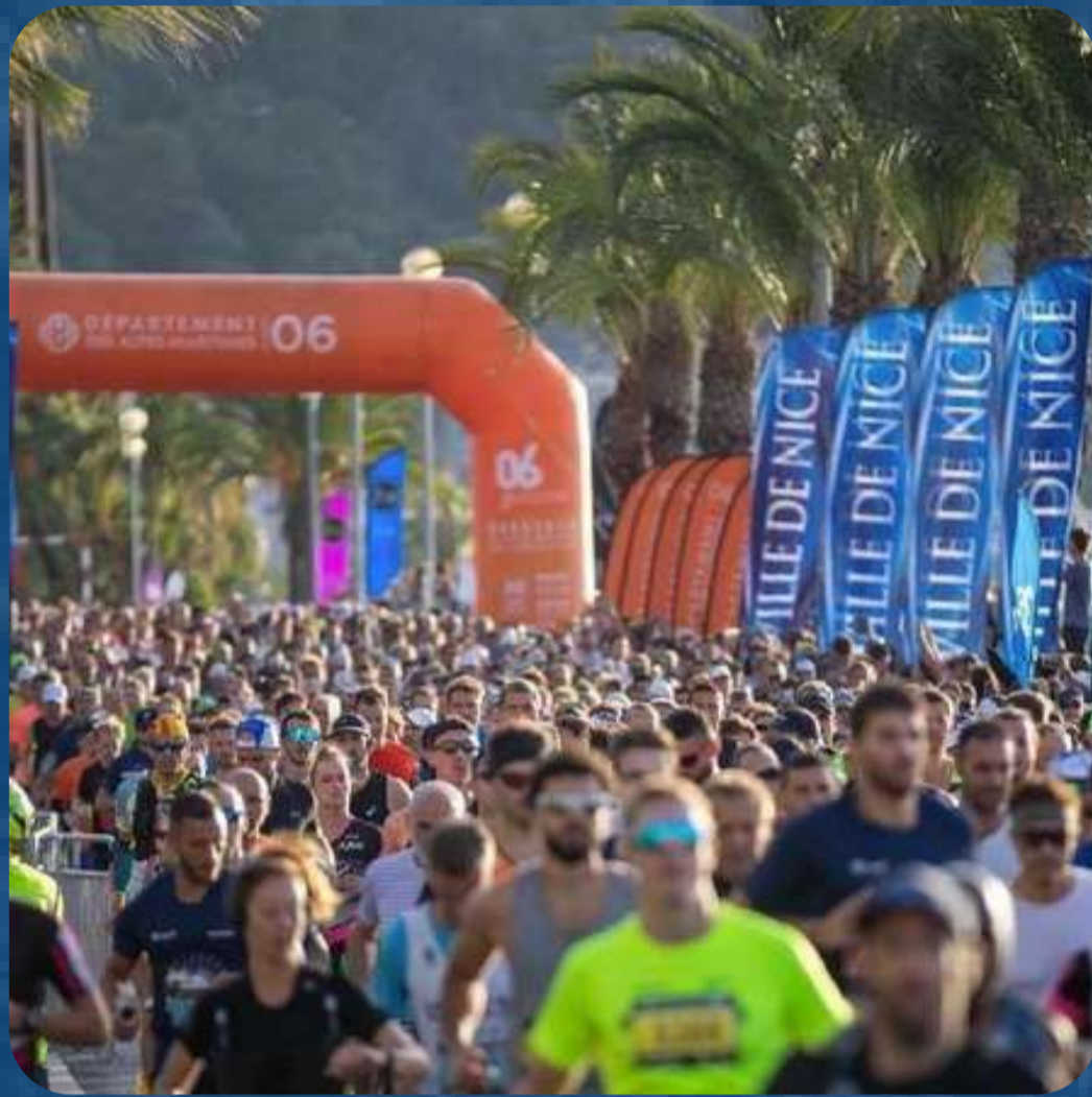
“Le départ sur la Promenade des Anglais”