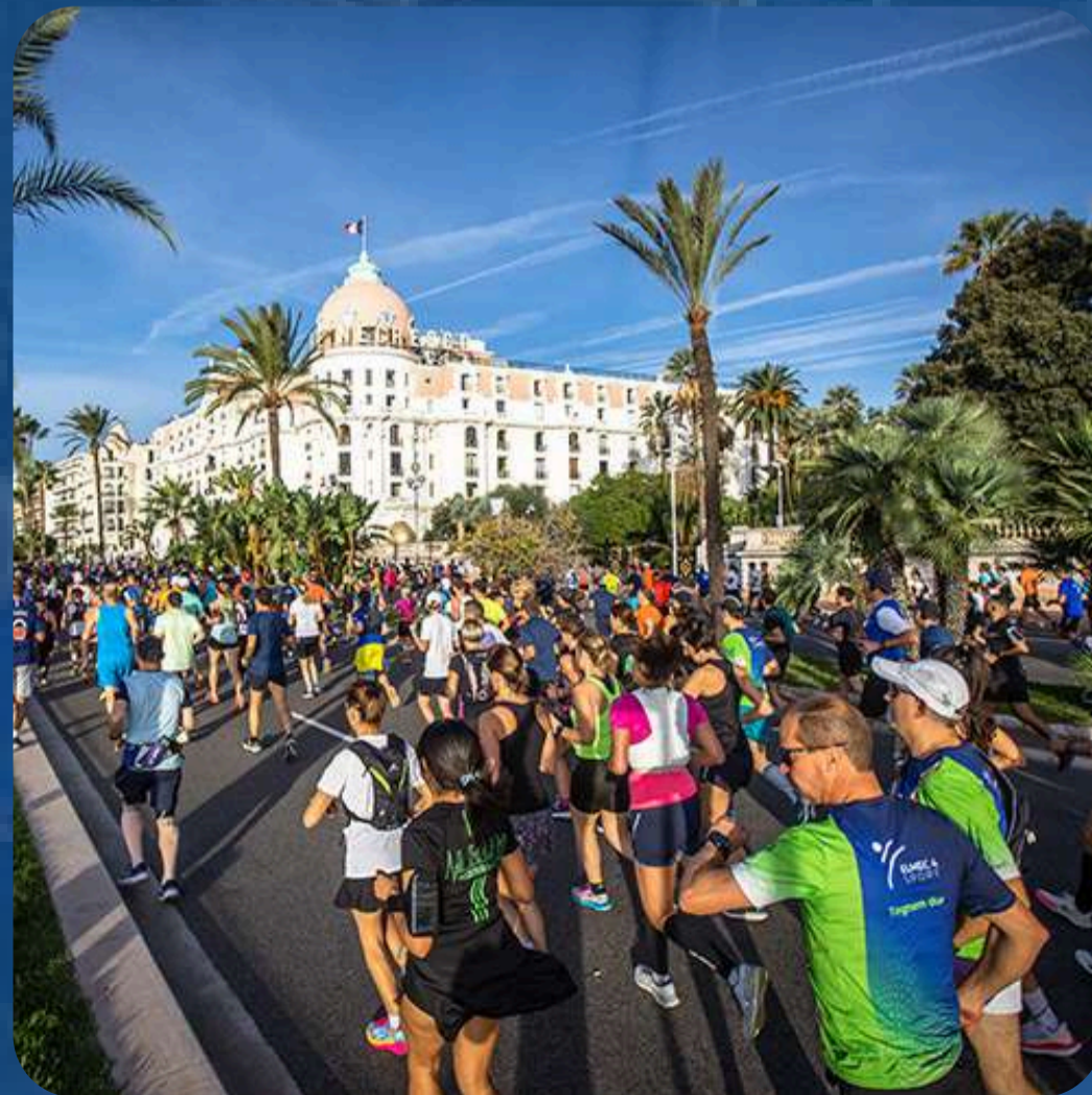
“Le Negresco depuis la Promenade des Anglais”