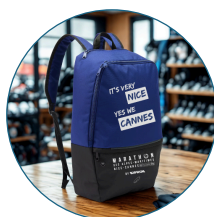
Sac à dos Bag